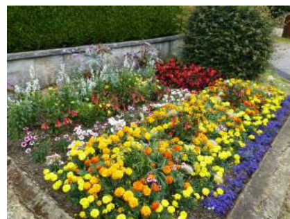
Réponse jeu de sept.14 : Cour du Périscolaire (Les Francas), galerie commerciale.