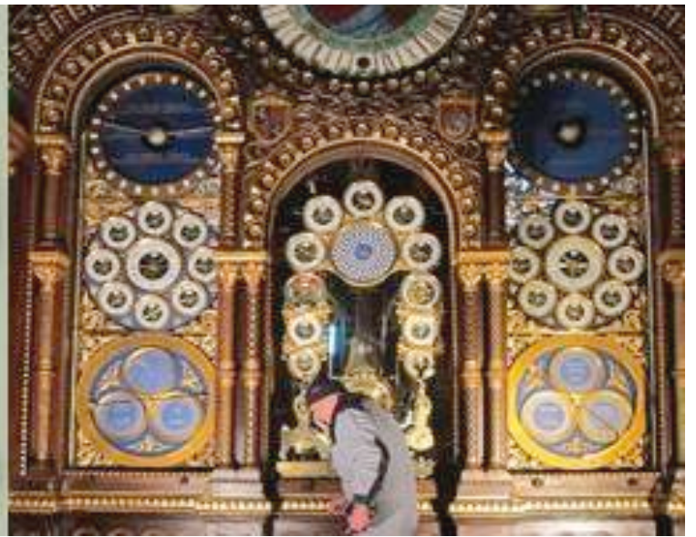
Horloge Astronomique de Beauvais

Forte de son expérience spécifique, l'entreprise propose ces nouveaux services qui nécessitent un savoir-faire dans l'intégration des édifices anciens ou classés (éclairage, sonorisation, chauffage masqué, boucle pour malentendants, alarme, etc.) et un savoir-travailler en hauteur (sur des bâtiments pas toujours conçus pour des évolutions techniques importantes.)