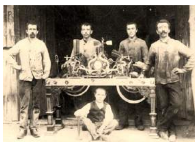
Horloge, expo Besançon, 1893