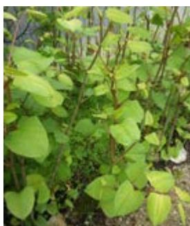
Renouée en haut de la grande rue à Mamirolle ce printemps

En premier lieu, la renouée du Japon élimine toute concurrence végétale et prive ainsi la faune locale de son habitat naturel.