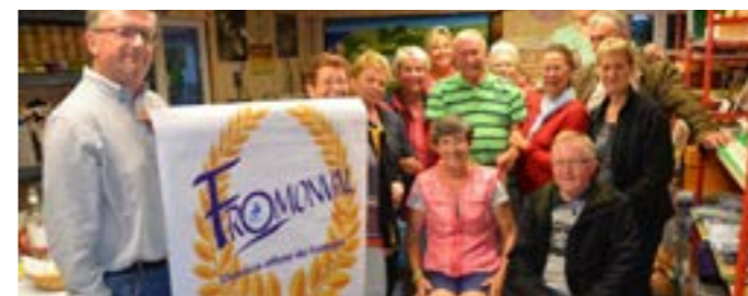
Comité de pilotage du concours Fromonval

Concours créé en 1990 à Trépot (25) à l'initiative de la Fromagerie-Musée.