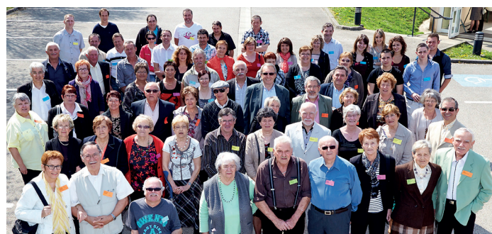
Banquet des classes de 2014

Le Comité d'Animation organise son 11 ème banquet des classes :