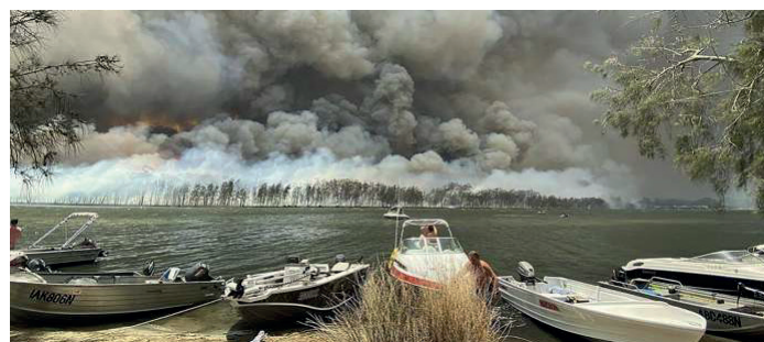
Incendie à proximité du lac Conjola, en Australie, 2 janvier 2020.