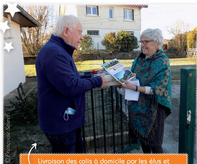
Livraison des colis à domicile par les élus et les membres du CCAS de Mamirolle