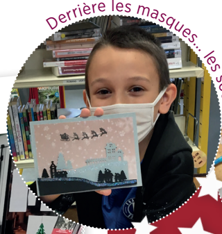
Derrière les masques... les sourires